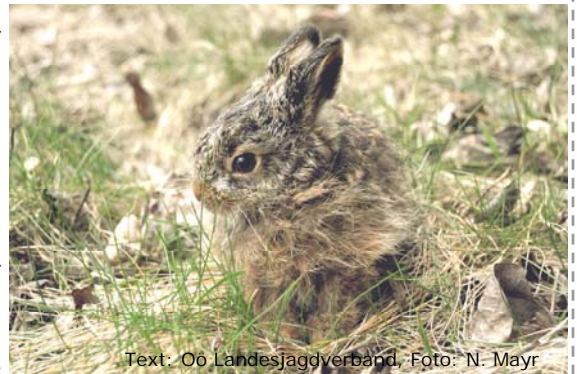
Text: Öo Landesjagdverband, Foto: N. Mayr

Weidmannsdank! Öo Landesjagdverband Weil Jagd mehr ist... www.oeljv.at