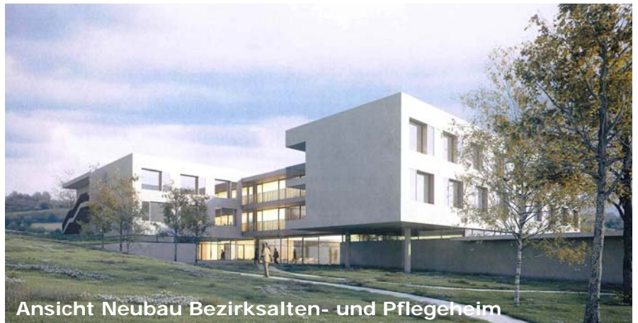
Ansicht Neubau Bezirksalten- und Pflegeheim

Der Sozialhilfverband Vöcklabruck und die Gemeinde Neukirchen an der Vöckla laden sehr herzlich zum Spatenstich für das neue Bezirksalten- und Pflegeheime Neukirchen an der Vöckla am Samstag, 22. November 2014, 14.00 Uhr ein. Die Feierlichkeit wird musikalisch von der Musikkapelle Neukirchen an der Vöckla umrahmt.