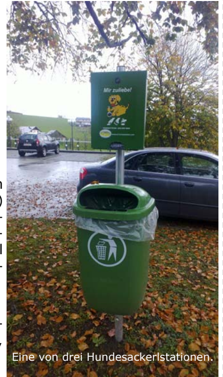
Eine von drei Hundesackerlstationen.

Parkplatz Raiffeisenbank, Öffentlicher Spielplatz bei GH Frodlhof, Dr.-Böhm-Weg