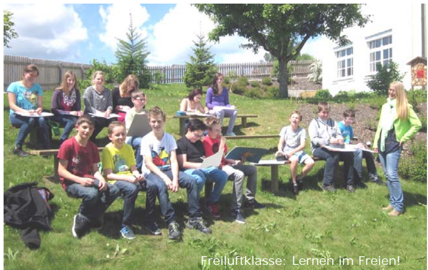
Freiluftklasse: Lernen im Freien!

Ziel ist eine leistungsdifferenzierte Allgemeinbildung, die sowohl als Vorbereitung für eine weiterführende Schule mit Matura als auch als solide Grundlage für den Einstieg ins Berufsleben bestens geeignet ist.