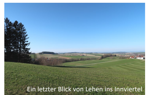
Ein letzter Blick von Lehen ins Innviertel

Tourenbeschreibung: Strecke 43 km, Anstieg und Abfahrt ca. 670 m. Fahrbahn: Asphalt mit einigen Schotterabschnitten und Wiesenwegen.