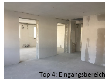
Top 4: Eingangsbereich

Besichtigungen sind nach Absprache gerne jederzeit möglich.