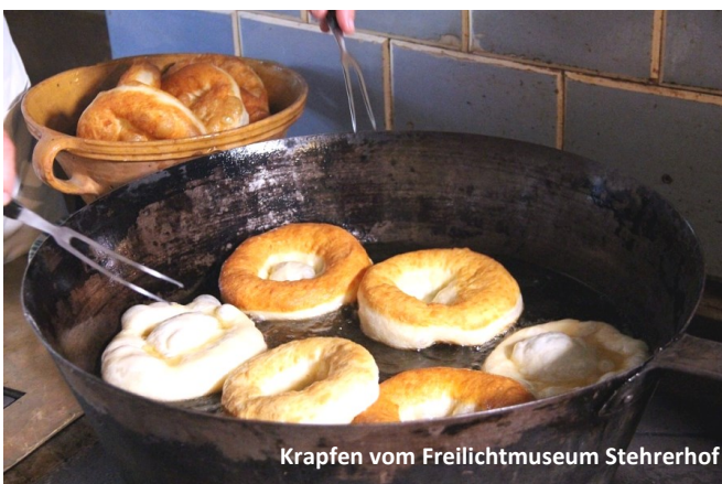
Krapfen vom Freilichtmuseum Stehrerhof