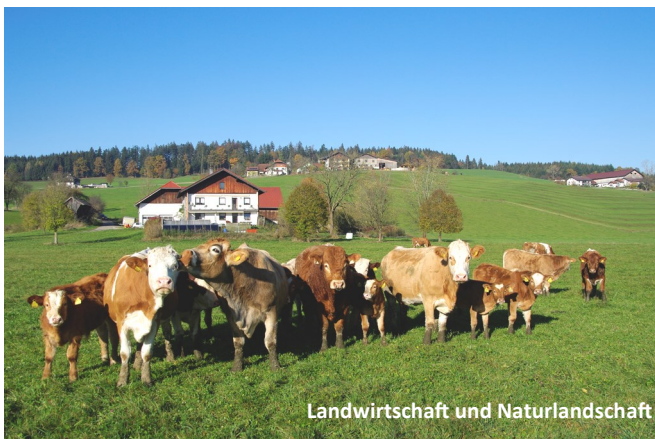
Landwirtschaft und Naturlandschaft