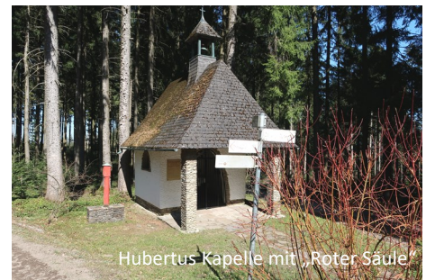
Hubertus Kapelle mit „Roter Säule“