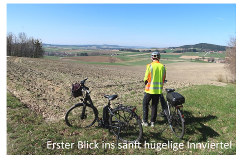
Erster Blick ins sanft hügelige Innviertel