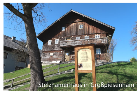
Stelzhamerhaus in Großpiesenham