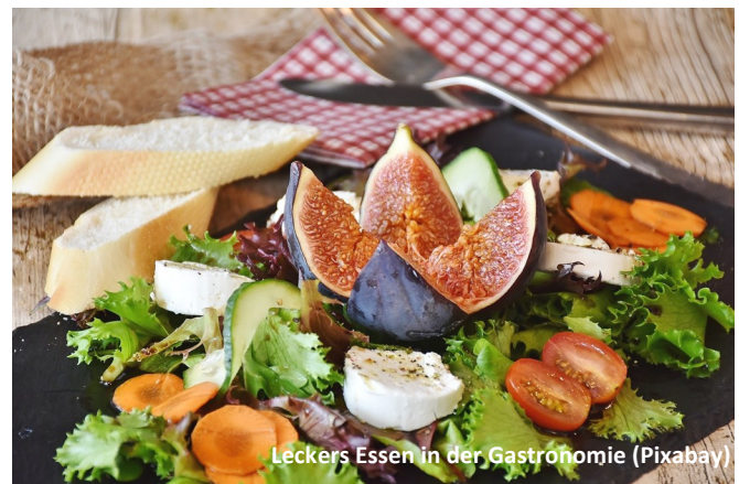
Leckers Essen in der Gastronomie (Pixabay)