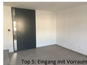
Top 5: Eingang mit Vorraum